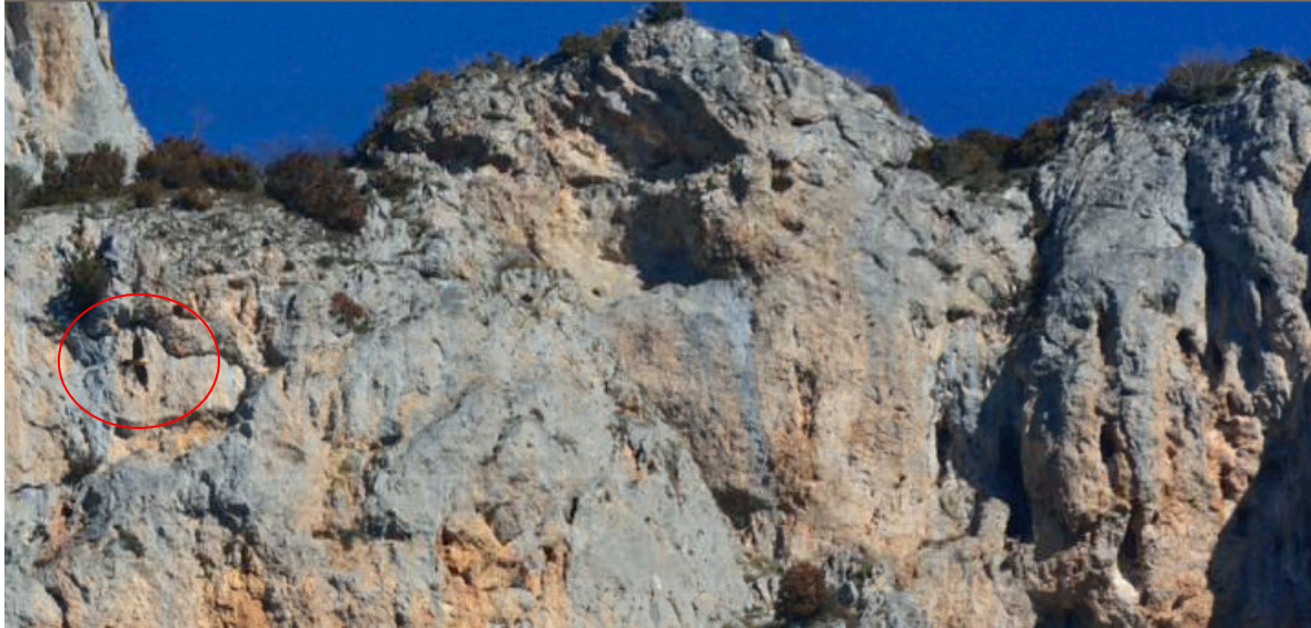
Couple de Gypa observé sur site début décembre au moment de leur reproduction.